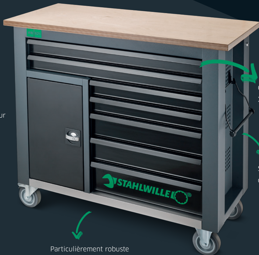
Grands tiroirs XXL

Comprend deux sorties de câble et un guide-câbles sur la paroi arrière.