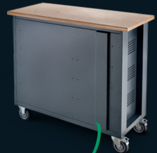
Conduit de câbles

La répartition unique avec deux tiroirs XXL, cinq autres tiroirs et la partie armoire assurent une grande flexibilité d'équipement et font du WB621 le partenaire idéal pour le rangement des outils dans l'artisanat et l'industrie. Des matériaux de qualité supérieure garantissent la longévité caractéristique de STAHLWILLE. La structure robuste, les tiroirs ainsi que le revêtement en sont de bons exemples. Le nouveau design avec des tiroirs noirs se distingue particulièrement.